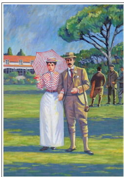
Grand-duc Michel et Comtesse de Torby